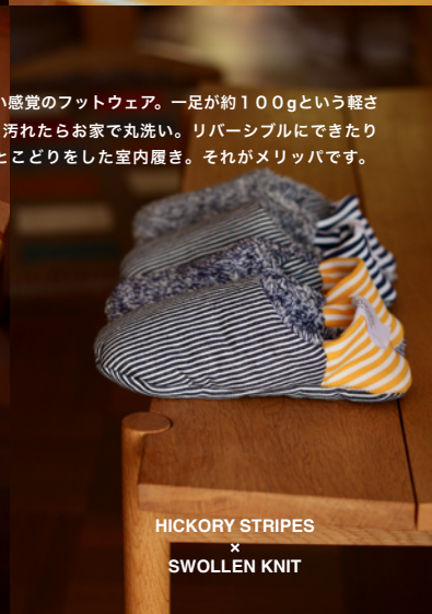
HICKORY STRIPES × SWOLLEN KNIT