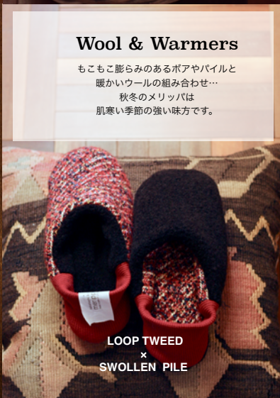
LOOP TWEED × SWOLLEN PILE

Wool & Warmers もごもご膨らみのあるポアやパイルと暖かいウールの組み合わせ… 秋冬のメリッパは肌寒い季節の強い味方です。