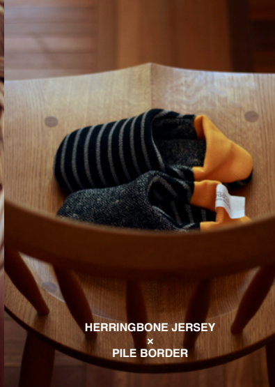
HERRINGBONE JERSEY × PILE BORDER