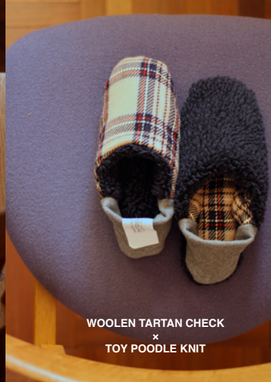
WOOLEN TARTAN CHECK × TOY POODLE KNIT