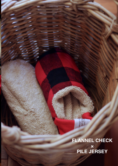
FLANNEL CHECK × PILE JERSEY