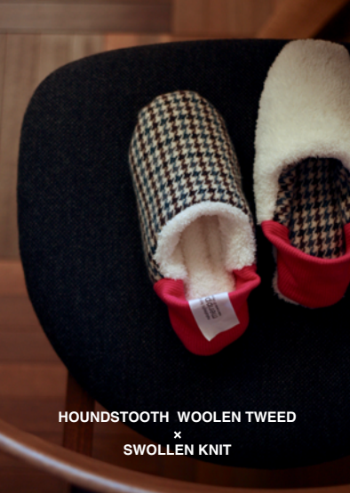
HOUSTOOTH WOOLEN TWEED × SWOLLEN KNIT