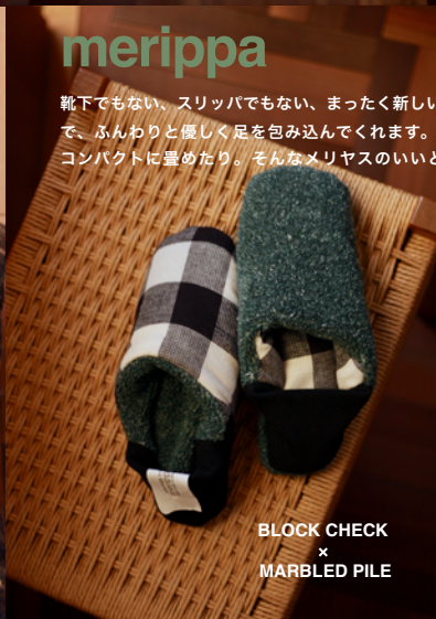
BLOCK CHECK × MARBLED PILE

Wool & Warmers もごもご膨らみのあるポアやパイルと暖かいウールの組み合わせ… 秋冬のメリッパは肌寒い季節の強い味方です。