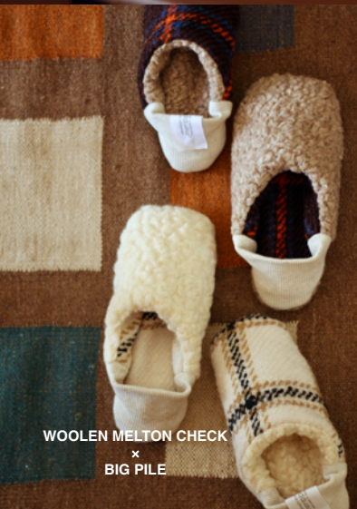
WOOLEN MELTON CHECK × BIG PILE