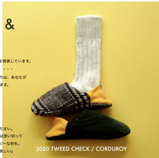
2020 TWEED CHECK / CORDUROY