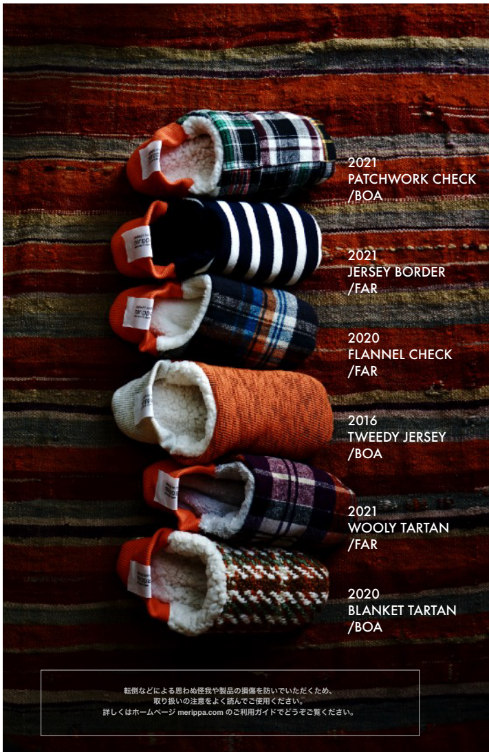
2021 PATCHWORK CHECK /BOA