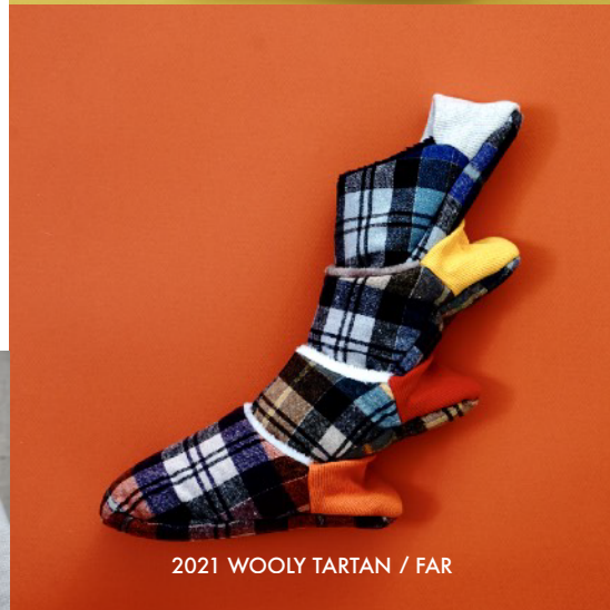
2021 WOOLY TARTAN / FAR